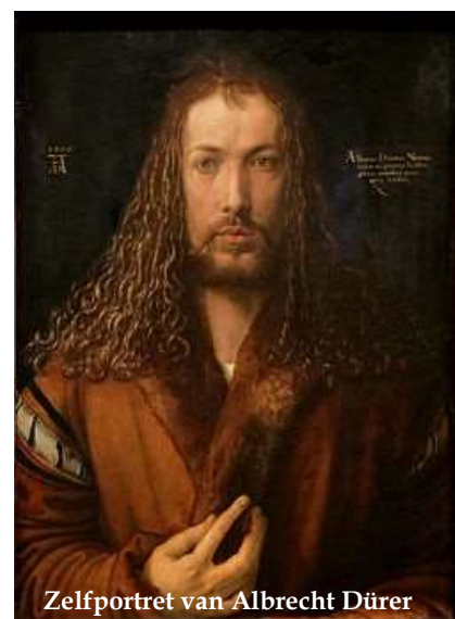
Zelfportret van Albrecht Dürer

Dat deze kerk twee torens had weten we door een bezoek van de beroemde schilder Albrecht Dürer aan Heerewaarden in 1520. Ook op het schilderij De blokkade van Bommel van 1574 in het stadkasteel in Zaltbommel zijn duidelijk de twee torens te zien van 'Herwaerden'.