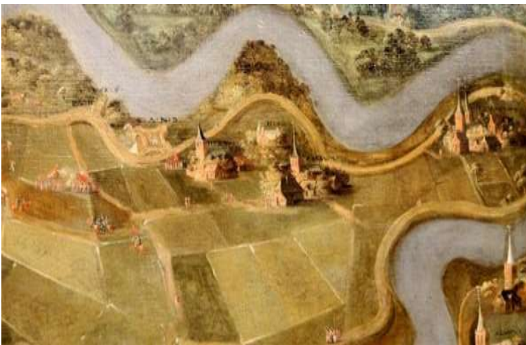
De blokkade van Bommel in 1574. Rechts boven de twee torens. Het zuiden is boven en het noorden onder.

In de Tachtigjarige Oorlog werd de strategische ligging van Heerewaarden erkend door Prins Maurits, die er twee forten liet bouwen: De Voorn en (oud) Fort St. Andries. In dat laatste fort heeft hij ook echt gewoond. Tegenwoordig zijn deze twee forten vooral vanuit de lucht te herkennen in het landschap. In de geschiedenis van Heerewaarden heeft de kerk van oudsher een belangrijke rol gespeeld. Nadat Otto III van het Duitse rijk Heerewaarden aan bisschop en benedictijner monnik Notgerus van Luik had gegeven, werd waarschijnlijk op bevel van deze ondernemende en creatieve kerkvorst al vóór 1200 de eerste kerk in Heerewaarden gesticht. Dank zij de bloeiperiode van de stad, waardoor Heerewaarden zich kon meten aan Tiel, Zaltbommel en Den Bosch, werd deze eerste kerk-met als teken van welvaart twee torens-al gebouwd vóór 1200. Deze had volgens sommigen kenmerken van de Ottoonse architectuur, die invloeden onderging van de Karolingische en Byzantijnse stijl. Anderen denken aan een Romaanse kerk.