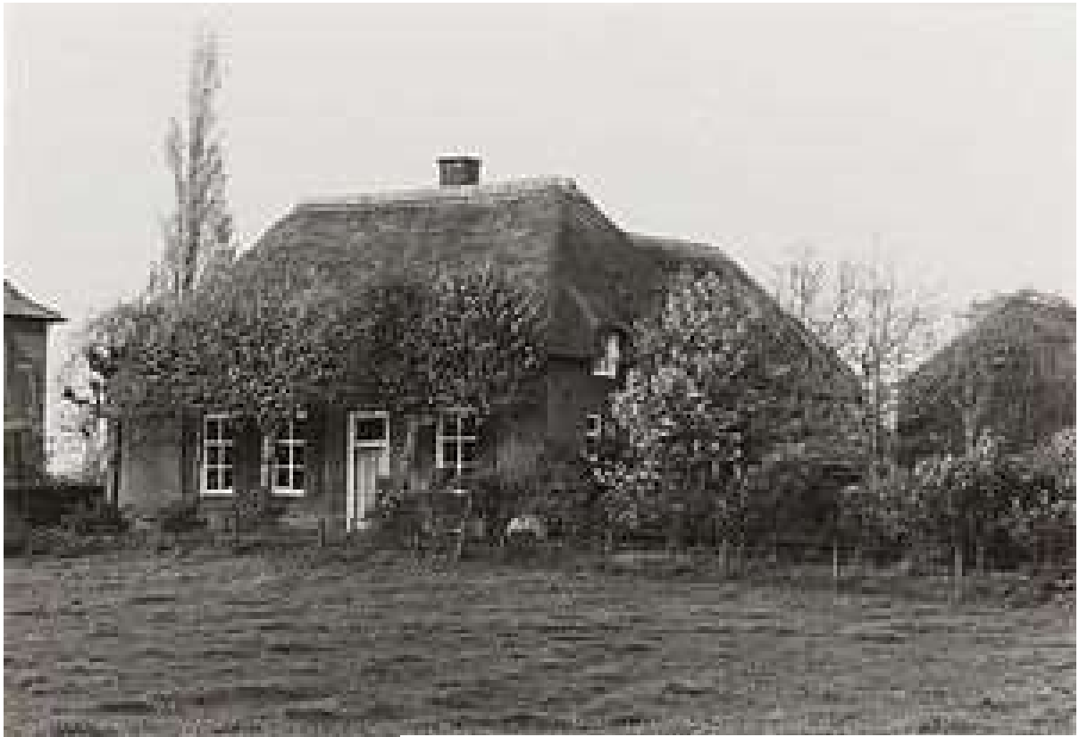
Boerderij Lithoijen Weissestraat 1