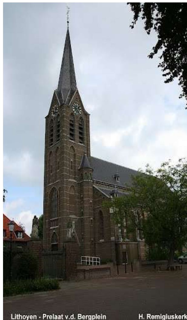
Lithoyen - Prelaat v.d. Bergplein