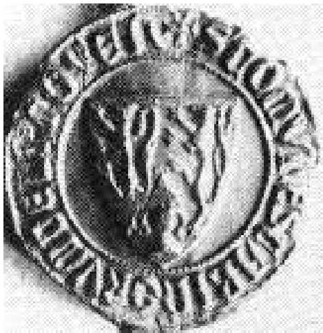
Zegel van Litoijen

voorstellen terug op het zegel waarmee in de eeuwen daarvoor de schepenen van een plaats hun officiële stukken hadden bekrachtigd.