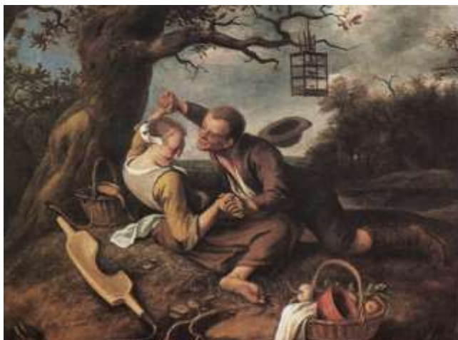
Jan Steen, Stoeiend paar (1660-1663) - het gesloten vogelkooitje gaf de aanwijzing dat de afgebeelde vrouw nog maagd was

In 1656 kondigden de Staten-Generaal het 'Egt-reglement over de steden ende ten platten lande, in de heerlijkheden, ende dorpen staende onder de Generaliteyt' af. In deze regeling werd gedetailleerd ingegaan op de juridische en maatschappelijke aspecten van het huwen: ondertrouw, huwelijksafkondigingen, de huwelijksluiting, de daarbij behorende vereisten, zedelijkheidswetgeving, echtscheiding etc. Net als de Politieke Ordonnantie van 1580 voor de 'gewone' gewesten van de Republiek, maakte deze een einde aan de plaatselijke en gewestelijke regelingen.