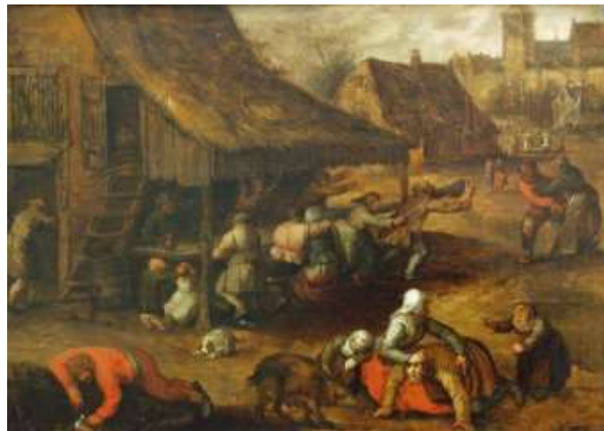
Messentrekkerij op een boerenkermis