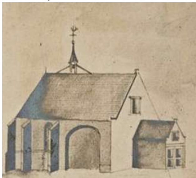
Tekening van het oude tufstenen kerkje

Lithoijen wordt voor het eerst in de geschiedenis genoemd in het jaar 991, wanneer de Franse koning Hugo Capet de eigendomsrechten van de Sint-Remigiusabdij te Reims op goederen in onder meer Lithoijen bevestigt. Hier wordt gesproken van Litta of Klein-Lith, in tegenstelling tot Groot-Lith, of gewoon Lith. De betreffende hoeve lag in Het Groenewoud, tussen Lith en Lithoijen. In 1222 werden hier acht laathoeven geteld. Het gebied behoorde toen tot het Kwartier van Maasland van de Meierij van 's-Hertogenbosch.