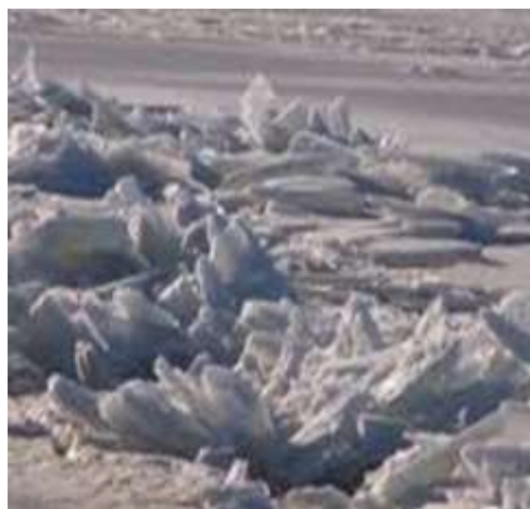
Kruierend ijs op de maas bij Lith