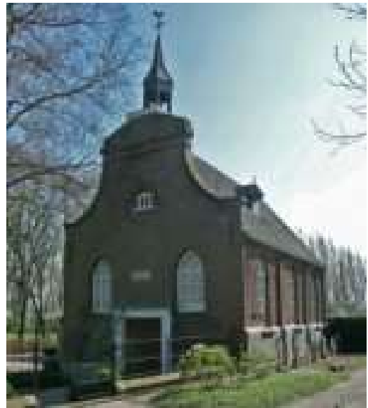
NH Kerk te Oijen