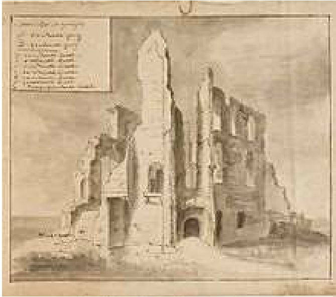
Kasteel Rossum (17e eeuw)