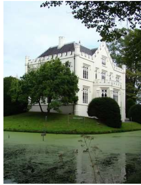
Slot Rossum 2007

De watersnood, die de gehele Bommelerwaard overspoelde in het najaar van 1860 ging ook aan Rossum niet voorbij. Het noodlot wil dat na het hoge water de strenge winter kwam van 1860-1861; in korte tijd was het dorp met een dikke ijslaag bedekt. Toen het water verdwenen was, waren vele oude huizen er zo slecht aan toe, dat sloop de enige mogelijkheid was. Voor diegene die een huis was kwijtgeraakt, bouwde men andere in het buurtschap Rome. Omstreeks 1880 werd de Waaldijk verhoogd en de Kloosterdijk rond 1902. Het dorp Rossum was beslist geen groot dorp. De wegen waren verhard met grind en in het midden van klinkers voorzien paardenpad dat in de winter moeilijk begaanbaar was.