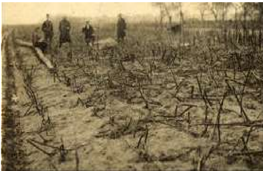
Oogsten gingen verloren.