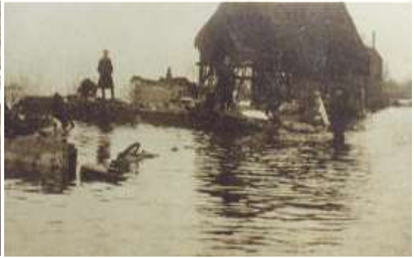
Landerijen stonden onder water.