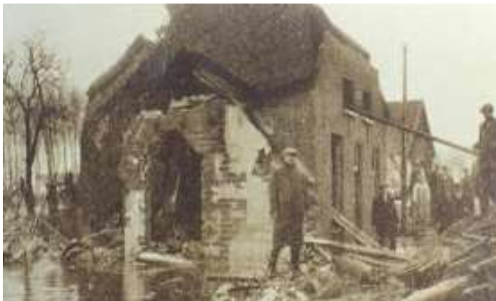
Het water had een verwoestende werking op de aanwezige bebouwing

Navolgende foto's, afkomstig van de website van Tremele.nl laten zien hoe een dorp eruit kan zien als het water heeft toegeslagen. De foto's hebben betrekking op de watersnoodramp in 1926.